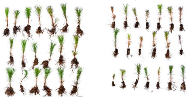
Tallplantor (krukvolym 30 cm 3 ) planterade i maj 2018 i Hälsingland. Skördade i oktober samma år. Notera den kraftfullt förbättrade rotutvecklingen och de längre sekundärbarrarna på arGrow® granulat behandlade plantor till vänster i bild.